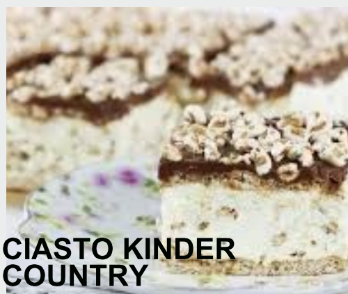
CIASTO KINDER COUNTRY